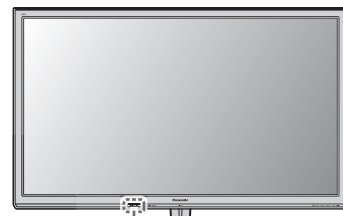
赤・電源 / 緑・受像 (イラスト:TH-P50GT5)